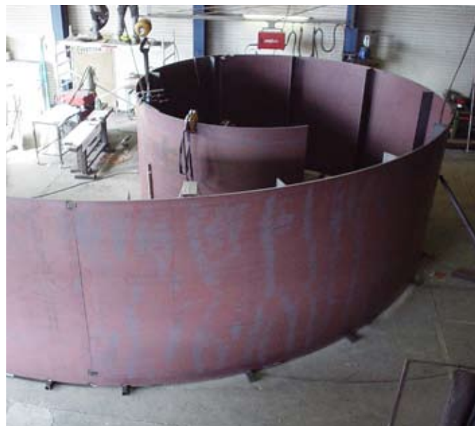
2 | 3

In der Mitte des neuen Kreisels thront ein Stahlzylinder mit spiralförmiger Abwicklung auf einem abgeschrägten Grassockel. Auf diesem Zylinder stehen scherschnittartig Fragmente von Möbelstücken. Diese frei angeordnete Komposition lebt durch die Prägnanz der Formensprache. Der walzrohe Stahl wird durch die Witterungseinflüsse eine einheitliche Rostpatina erhalten. Die Skulptur wird von Aussen mit LED-Strahler angestrahlt und im Innern mit Flutern der Raum ausgeleuchtet. Diese Art von Form und Materialisierung der Kreiselgestaltung wird wohl einzigartig sein