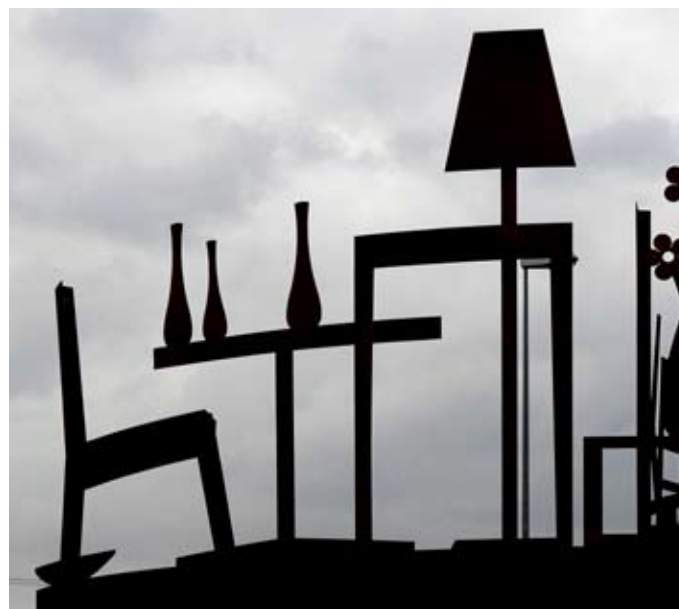
4 | 5

Sockel: Rasen Kreiselskulptur: Stahl gewalzt selbstrostend Beleuchtung innen: Focalflood, varychrom Fluter Beleuchtung aussen: LED-Downlight